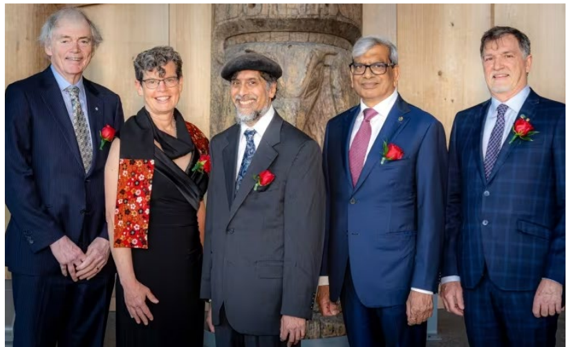
Gala de remise des Prix Killam, organisé par le Conseil national de recherches du Canada, à Gatineau, au Québec (17 mai 2023)

Merci de nous aider à propulser et à célébrer l'innovation au Canada!