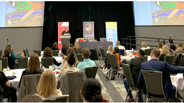
Congrès de l'ACCS (16 au 18 mai 2023)