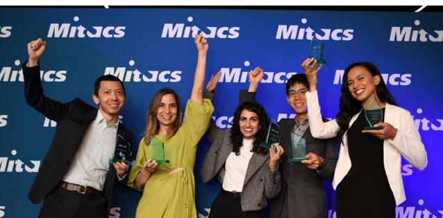
Remise des Prix de l'entrepreneuriat Mitacs (18 mai 2023)

Merci de nous aider à propulser et à célébrer l'innovation au Canada!